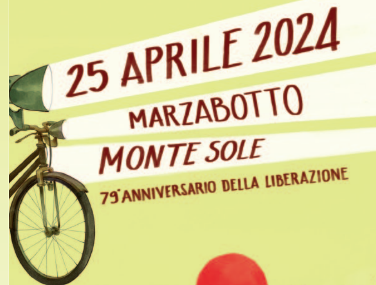
illustrazione di Grazia La Padula - impaginazione e stampa www.agystudio.com

Presenterà la giornata lo staff di Radio Frequenza Appennino